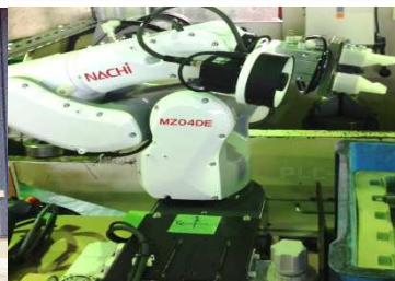
垂直多関節ロボット